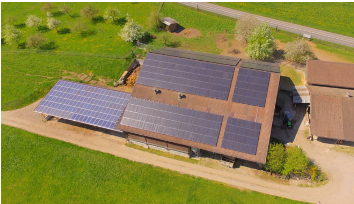
Fig. 1: PV Anlage Schmid in Birri mit 155 kWp.

Ökologische Stromproduktion und langfristig gesicherter Stromabsatz sind wichtig für ein nachhaltiges Geschäftsmodell. Die genossenschaftliche PV-Anlage in Birri auf dem Hof der Familie Schmid hat eine Spitzenleistung von 155 kW (Fig. 1). Damit wird mehr Strom produziert als auf dem Hof verbraucht werden kann. Der nicht verbrauchte Strom wird ins Netz eingespeist, was allerdings wirtschaftlich nicht interessant ist. Beim Bau der PV-Anlage 2016 wurde deshalb die Möglichkeit eines lokalen Zusammenschlusses der Stromversorgung mit dem Nachbargebäude bereits vorbereitet. 2020 wurde dieses in ein Mehrfamilienhaus umgebaut und ein ZEV mit 14 versorgten Kunden in Betrieb genommen. Der Eigenstromanteil konnte von unter 20% auf über 40% gesteigert werden. Zusätzlich benötigter Strom wird gemeinsam über den ZEV vom Netz bezogen.